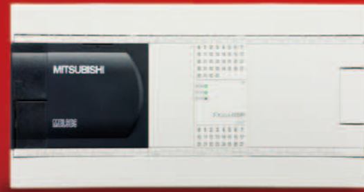
FX3GA-60MR-CM FX3GA-60MT-CM 输入 36 点 / 输出 24 点