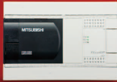
FX3GA-40MR-CM FX3GA-40MT-CM 输入 24 点 / 输出 16 点