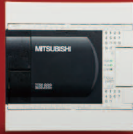
FX3GA-24MR-CM FX3GA-24MT-CM 输入 14 点 / 输出 10 点