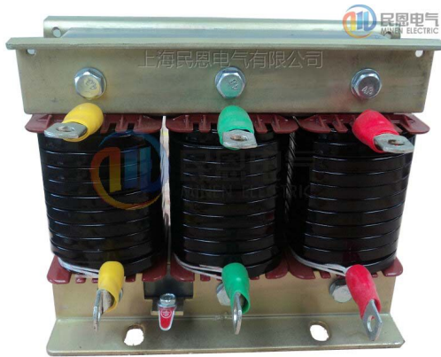
( 低压电容器专用串联电抗器 )