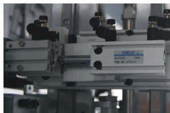
气立可气缸&感应器