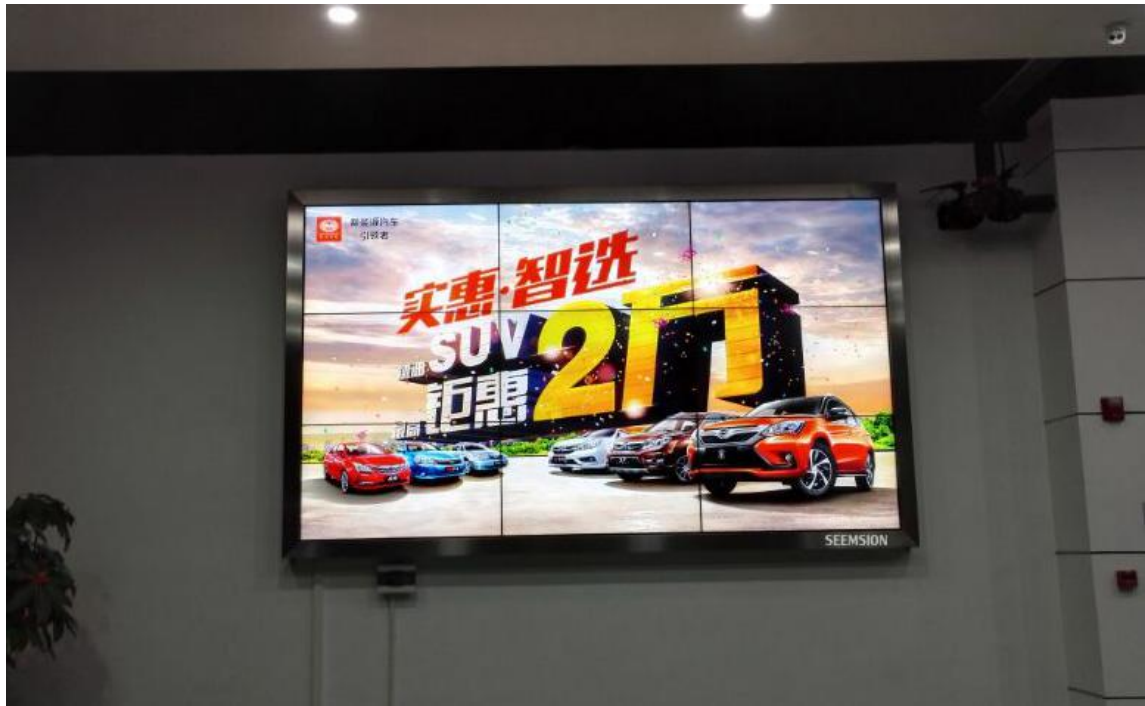
厦门 BYD 比亚迪 4S 店