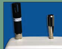
可拆卸式温湿度和等动力探头