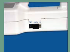
轻松连接计算机下载数据