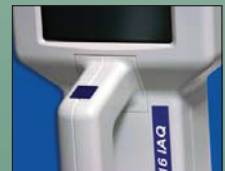
仪器把手设有开关控制按钮