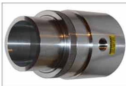
空气放大器应用比较