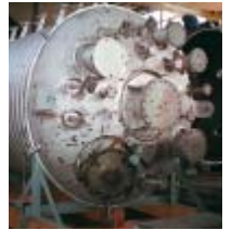
图1: 双相不锈钢制造的高防腐性能的锅炉

化学和石油化工行业越来越多地使用双相钢，例如：图1和图2中的锅炉容器就是用高防腐性能的双相不锈钢制造的。如果焊缝处的铁素体含量过低，受到张力或发生振动时容易破裂。然而，在焊接双相钢时，由于焊接添加剂或热处理不当，焊缝处的铁素体含量非常容易超标。只有现场检测才能确保处理过程不会改变最佳的铁素体含量，防止机械性能或防腐性能的下降。