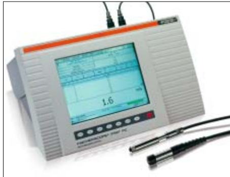
FISCHERSCOPE MMS PC 是一款多功能的测试仪器，可集成磁感应、电涡流和beta射线等方法测量涂镀层厚度和材料测试