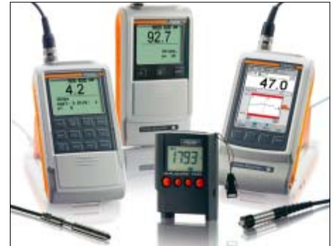
ISOSCOPE, DELTASCOPE 和 DUALSCOPE 内置一体化或外置独立探头的手提式仪器，可在现场快速简便地测量涂镀层厚度

该手册包含的一般描述或性能特征，可能不适用于所有已描述的具体应用，或者由于产品更新会有更改。这些性能特征只有在合同中表述才具有约束力。