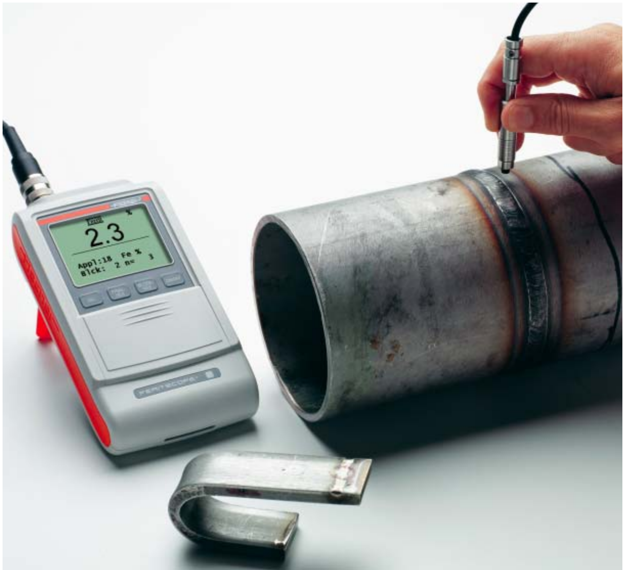
用FERITSCOPE FMP30测量焊缝内的铁素体含量

FERITSCOPE根据磁感应方法测量奥氏体钢和双相钢中的铁素体含量。仪器能识别所有的磁性部件，也就是说，除了delta铁素体，还能识别其转化形式马氏体。仪器符合Basler标准和DIN 32514-1标准，适合于现场检测，可以测量奥氏体覆层、不锈钢管道、容器和锅炉焊缝内以及奥氏体钢或双相钢制造的其他产品内的铁素体含量。