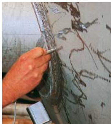
图2: 测量焊缝处的铁素体含量