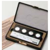
Fischer校准标准片套件（含证书）

为了获得可以比较的结果，仪器必须用可以追溯到国际上接受的二级标准片校准。为此，IIW（英国国际焊接协会）发展了二级标准片，由英国焊接协会根据DIN EN ISO 8249标准和ANSI/AWS A4.2标准规定的方法制造。Helmut Fischer提供鉴定过的校准标准片供客户校准仪器，这些标准片可以追溯到TWI二级标准片。标准片上标明了两种单位：铁素体个数FN和百分比含量%Fe。可通过发货前设置修正系数或用客户定制的标准片校准仪器来减少工件几何形状（曲率、厚度等）对测量的影响。不同的校准信息分别储存在不同的应用程序内。