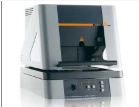
FISCHERSCOPE X-RAY XDAL根据X荧光射线方法测量镀层厚度和材料分析

作为一家技术上领先，高质量标准和搞客户满意度标准的公司，我们已通过DIN ISO 9001:2000认证。