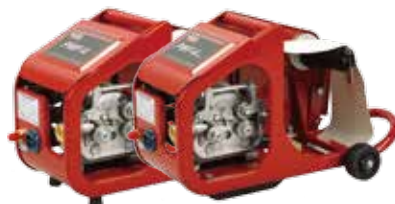
PWF™ - 4 / - 4Plus