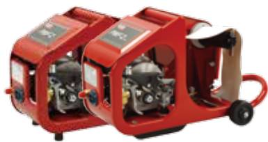
PWF™ - 2 / - 2Plus