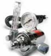
CO 2 气表