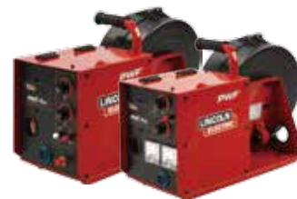
PWF™ - 4GS / - 4SS